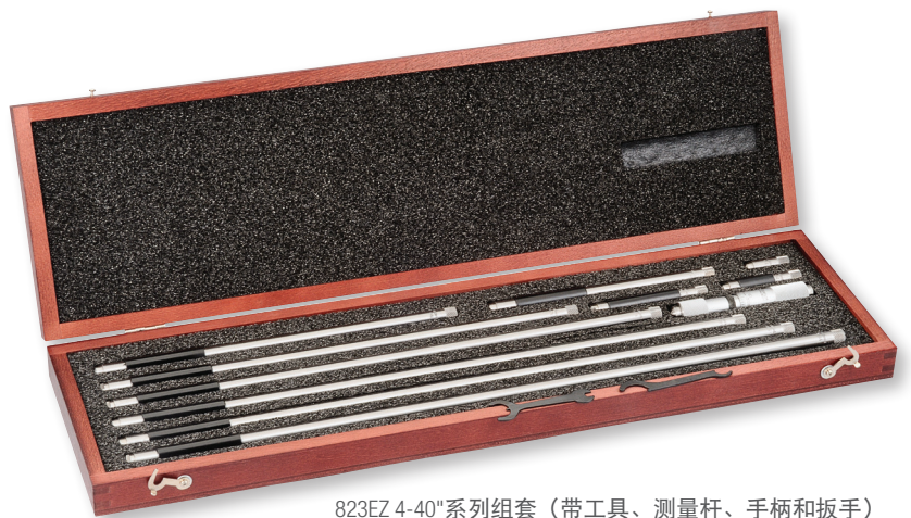
823EZ 4-40"系列组套（带工具、测量杆、手柄和扳手）